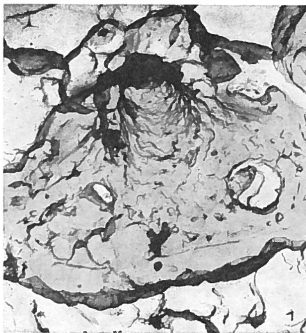
Fig. 1 — Ahmuellerella dietzmanni n. sp. Holotypus. Brg. Schlieven, Cenoman.